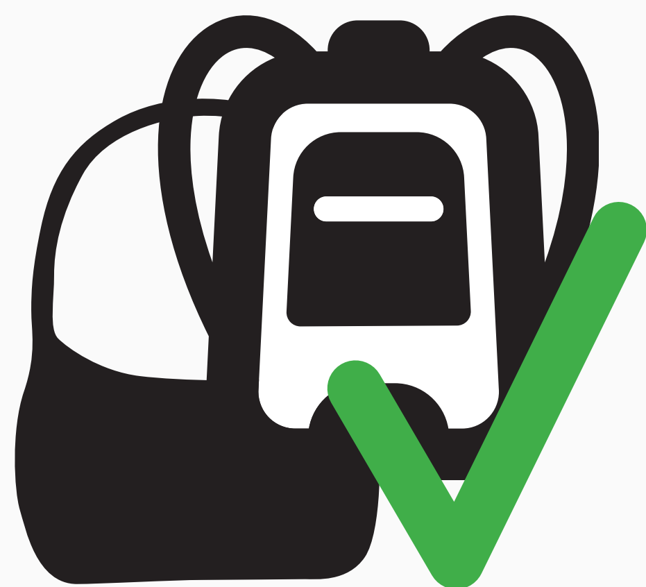
Kleine Handtaschen und Rucksäcke (bis 30cm x 30cm x 15cm) small handbags and backpacks (up to 30cm x 30cm x 15cm)