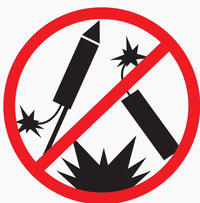
Pyrotechnische Gegenstände pyrotechnical devices