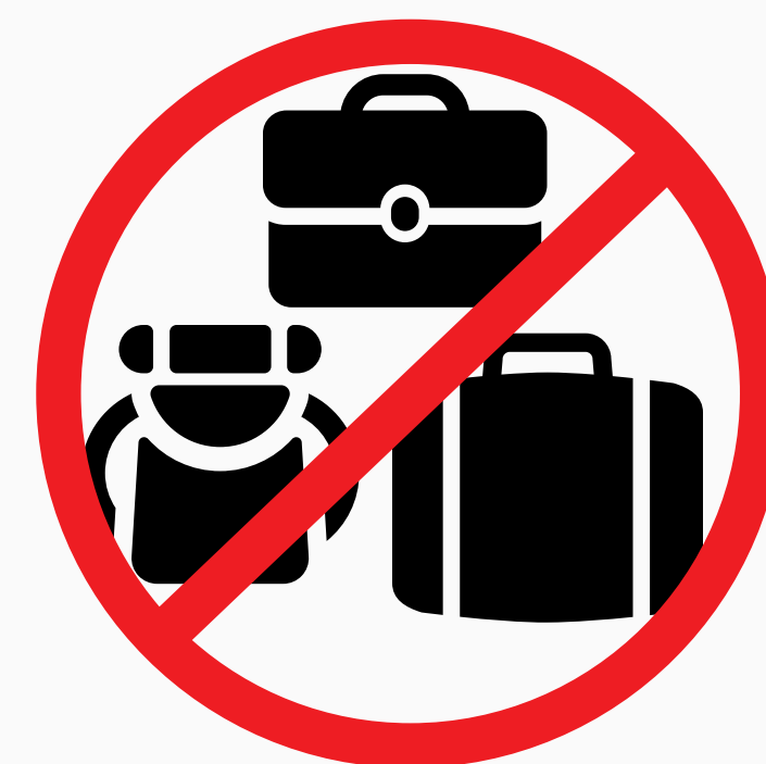
Große Rucksäcke, Taschen und Koffer large backpacks and bags, suitcases