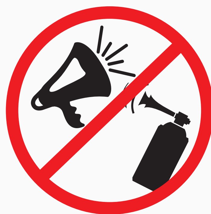
Mechanisch u. elektrisch betriebene Lärminstrumente, Vuvuzelas mechanical and electrical noise making devices, vuvuzelas