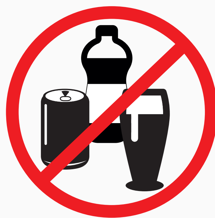
Glas- u. Plastikflaschen, Dosen, Tetra Pak > 0,5l, alkoholische Getränke glas and plastic bottles, cans, Tetra Pak > 0,5l, alcoholic drinks