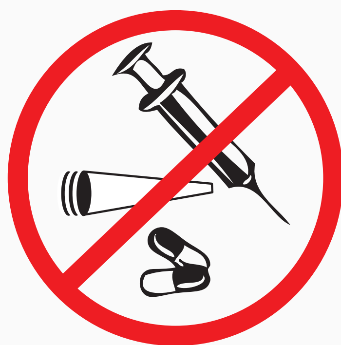
Drogen jeglicher Art drugs of any kind