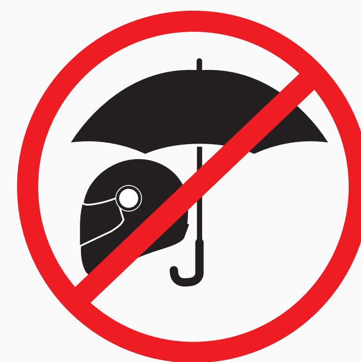
Stockregenschirme, Helme stock umbrellas, helmets