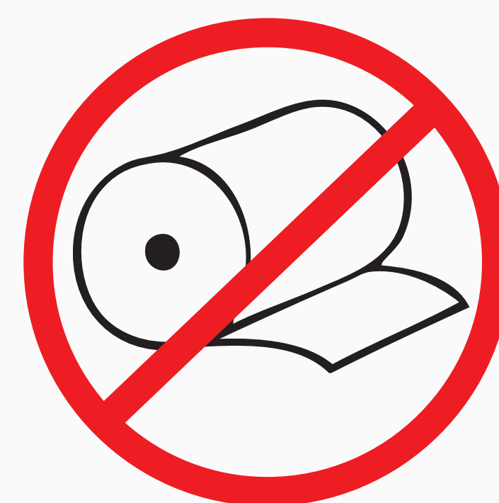
Brandlasterhöhende Materialien fire load enhancing material