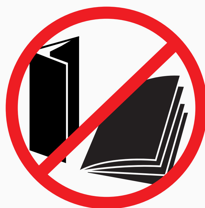
Werbende und kommerzielle Gegenstände, Flyer, Aufkleber promotional and commercial objects, flyer, sticker