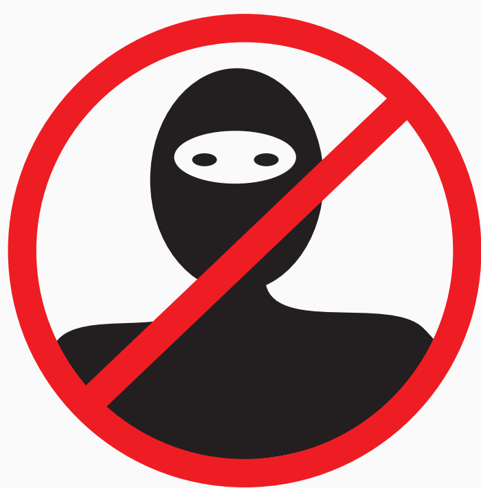
Gegenstände, die die Identifizierung verhindern können items that can prevent the identification