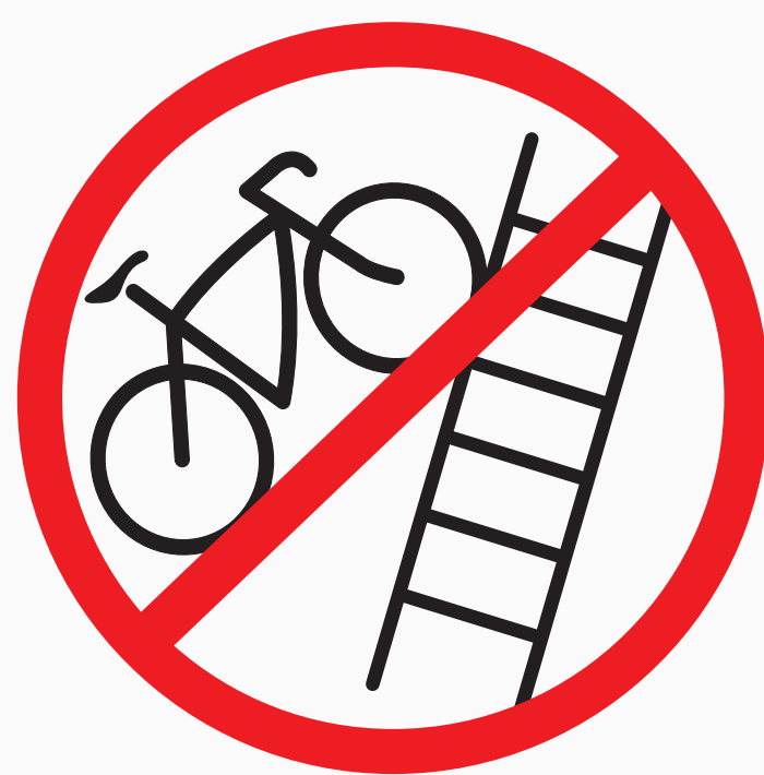
Sperrige Gegenstände bulky objects