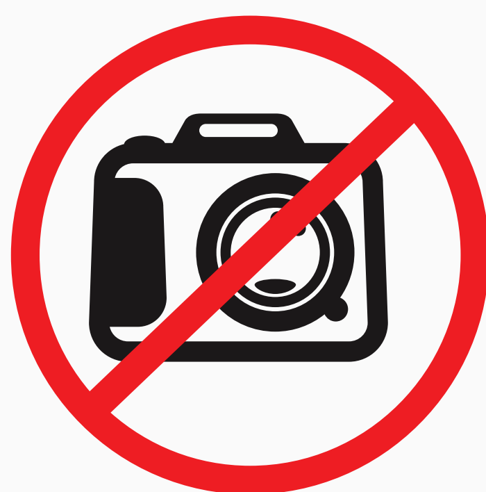
Professionelle Fotokameras mit Wechselobjektiv über 200mm Brennweite professional photo cameras with interchangeable lens higher than 200mm focal length