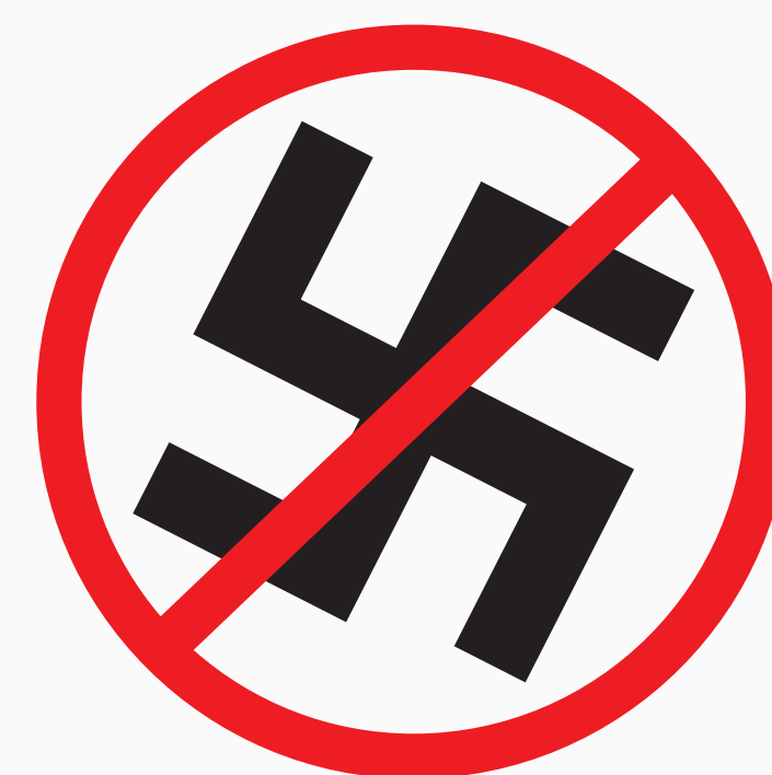
Rassistisches, fremdenfeindliches, diskriminierendes u. politisches Propagandamaterial racist, xenophobic, discriminatory and political propaganda material