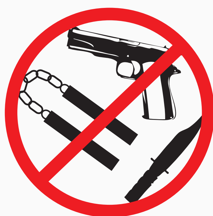
Waffen, gefährliche Gegenstände weapons, dangerous objects