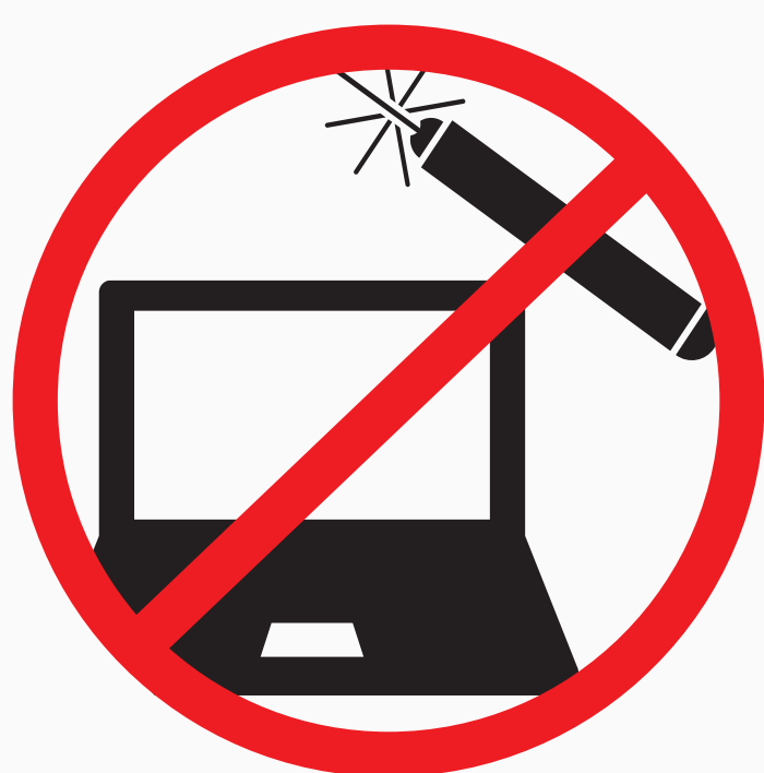
Laserpointer, Akkupacks, sonstige elektronische Gegenstände laser pointer, battery packs, other electrical items