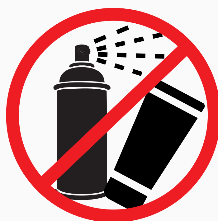
Gassprühdosen, Haarspray, große Kosmetikprodukte gas spray can, hairspray, large cosmetic products