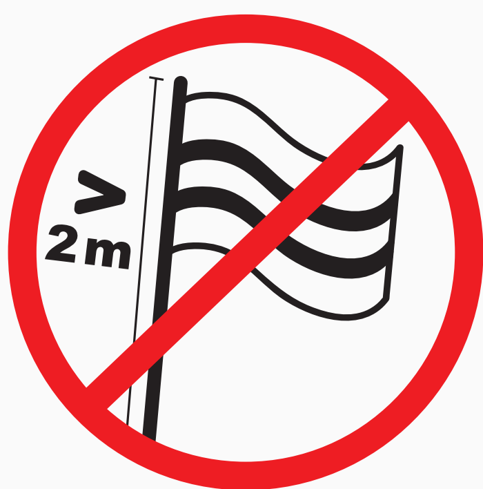
Fahnen u. Transparentstangen länger als 2m, übergroße Spruchbänder poles for flags and banners longer than 2m, oversize banners